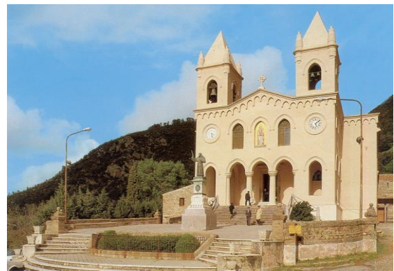
Santuario di Gibilmanna

Dopo la prima colazione, partenza per la città di Cefalù , situata all'ombra della Rocca a forma di testa (Cephaloedium), che da il nome alla città. Nel corso della passeggiata tra le viuzze medievali incontreremo l' Osterio Magno , edificio fortificato probabilmente di origine normanna, che sembra sia stata la residenza di re Ruggero. Da qui raggiungeremo Piazza Duomo dove, dominando l'intero abitato, si erge l'imponente Cattedrale Normanna . Meravigliosi mosaici adornano l'interno. Lo sguardo è subito attratto dalla maestosa immagine del Cristo Pantocratore , tra i più spettacolari esempi di mosaico bizantino in Sicilia. Continuando per Via Vittorio Emanuele vedremo il "lavatoio medievale" scavato nella viva roccia. Dopo il pranzo, partenza per il Santuario di Gibilmanna , luogo di culto e pellegrinaggio immerso nel verde dei boschi che ospita anche un