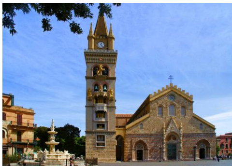
Cattedrale di Messina