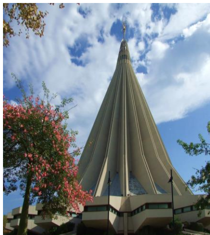
Santuario Madonna delle Lacrime