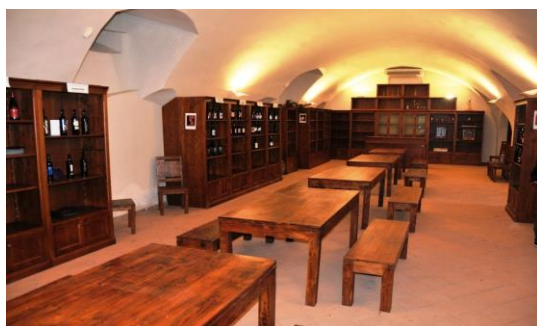
Enoteca Provinciale di Messina