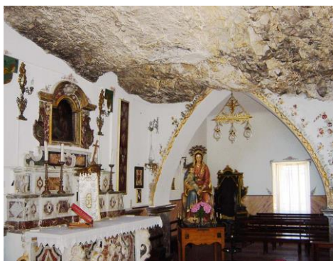
Santuario della Madonna della Rocca