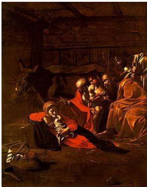
Adorazione dei pastori (Caravaggio)