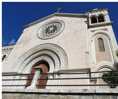
Chiesa Madre Castelmola

Colazione in hotel e partenza per Taormina . Dopo una passeggiata lungo le vie della "Perla dello Ionio", raggiungeremo il Santuario della Madonna della Rocca , posto su un panoramico colle e così denominato perché costruito sulla viva roccia. Nello spiazzo del Santuario vi è una grande croce in cemento armato che sovrasta tutta Taormina . Pranzo in un ristorante tipico.