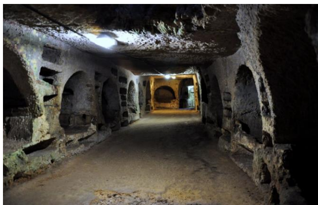
Catacombe di San Giovanni

Prima colazione in hotel e partenza per Siracusa , una delle più importanti città della “Magna Grecia”. Giunti al noto Santuario della Madonna delle Lacrime , assisteremo alla liturgia mattutina. Pranzo in ristorante.