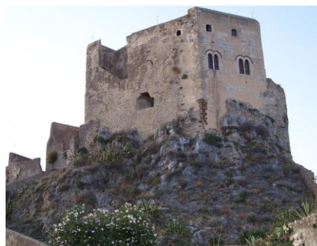
Castello "Rufo Ruffo"

Dopo la prima colazione in hotel ci recheremo presso l' Enoteca Provinciale di Messina , situata nei locali dell'incantevole Monastero Benedettino del 500 S. Placido Calonerò . Visita guidata del Monastero, degustazione di eccellenze vinicole e prodotti tipici locali. Nel pomeriggio visita al