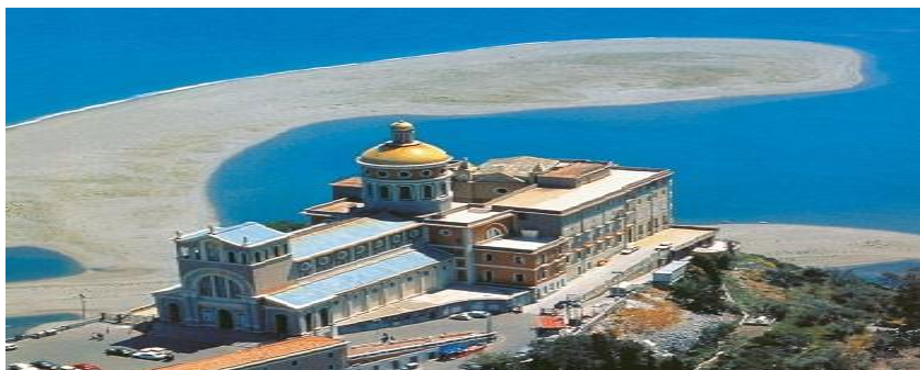
Santuario della Madonna del Tindari

Prima colazione in hotel e partenza per il Santuario dedicato alla Madonna Nera del Tindari , uno dei Santuari mariani più conosciuti in Europa. Al suo interno vi è la statua lignea della Madonna bruna , risalente al 750 d.C. o al periodo delle crociate.