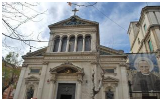
Basilica Santuario Sant'Antonio