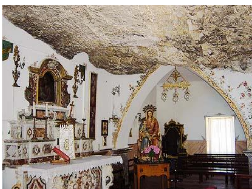
Madonna della Rocca

Colazione in hotel e partenza per Taormina . Dopo una passeggiata lungo le vie della "Perla dello Ionio", raggiungeremo il Santuario della Madonna della Rocca , posta su un panoramico colle e così denominato perché costruito sulla viva roccia. La sua origine è legata ad una leggenda. Nello spiazzo del Santuario vi è una grande croce in cemento armato che