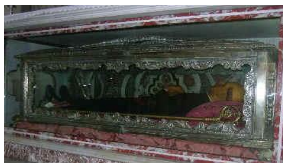
Corpo San Placido

Dopo la prima colazione in hotel, visita della Basilica Santuario di Sant' Antonio , edificato nell'antico quartiere " Avignone " dove Sant'Annibale , devoto a Sant'Antonio , nel 1878 iniziò il suo apostolato a favore dei più poveri e bisognosi. Al suo interno è stato realizzato il Museo "Annibale Di Francia" che custodisce una rappresentazione in scala del quartiere Avignone.