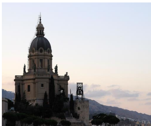
Santuario Cristo Re Santuario