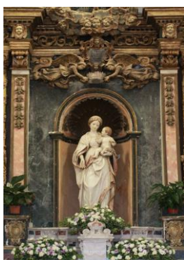
Madonna della Neve

Colazione in hotel, trasferimento in pullman privato a Santa Lucia del Mela , eretta sulle pendici del colle Makkarruna sul quale svetta un castello arabo, poi ristrutturato e ampliato da Federico II di Svevia .