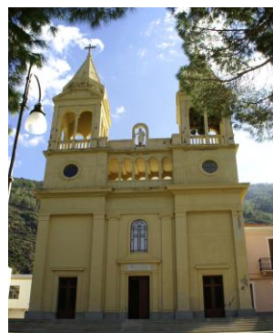
Santuario della Madonna del Terzito