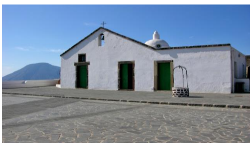
Santuario della Madonna della Catena