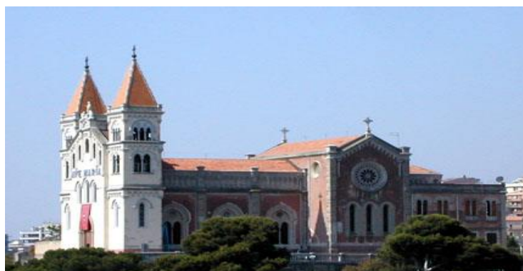
Santuario della Madonna di Montalto

Dopo la prima colazione, partenza per la visita del Santuario della Madonna di Montalto , situato sul Colle della Caperrina. E' stato il primo edificio di culto della città ricostruito nel post terremoto del 1908. Secondo una leggenda la sua fondazione è stata una volontà della Madonna, apparsa sotto forma di una Dama Bianca accorsa in difesa dei messinesi assediati dall'esercito francese durante la guerra del Vespro.