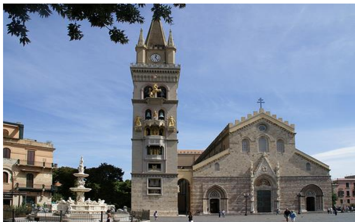
Cattedrale di Messina

Dopo la prima colazione in hotel, raggiungeremo la sede della Cattedrale di Messina dedicata