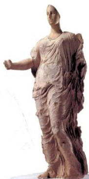
Dea di Morgantina

La Sicilia è una terra ricca di storia e cultura. Grazie a questo itinerario potrete scoprire le affascinanti tracce e i segreti degli insediamenti delle antiche popolazioni che hanno influenzato la storia e la cultura dell'intera regione.