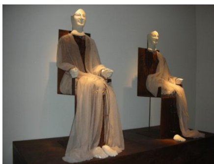
Acroliti di Demetra e Kore

Il pomeriggio sarà dedicato alla scoperta della cittadina arabo-normanna , ove è presente il “ Castellaccio ”, preziosi ruderi di una fortificazione medievale.